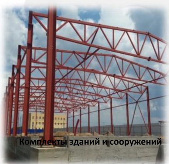
Комплекты зданий и сооружений